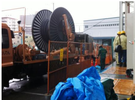
特別高圧ケーブル敷設工事