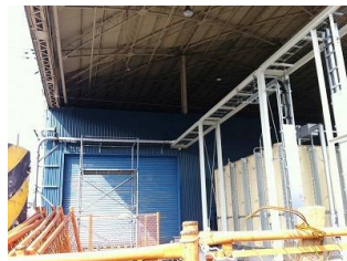
ケーブルラック敷設