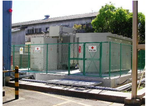
12000kVA変圧器+6kV高圧配電盤