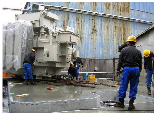
12000kVA特別高圧変圧器搬入・据付工事